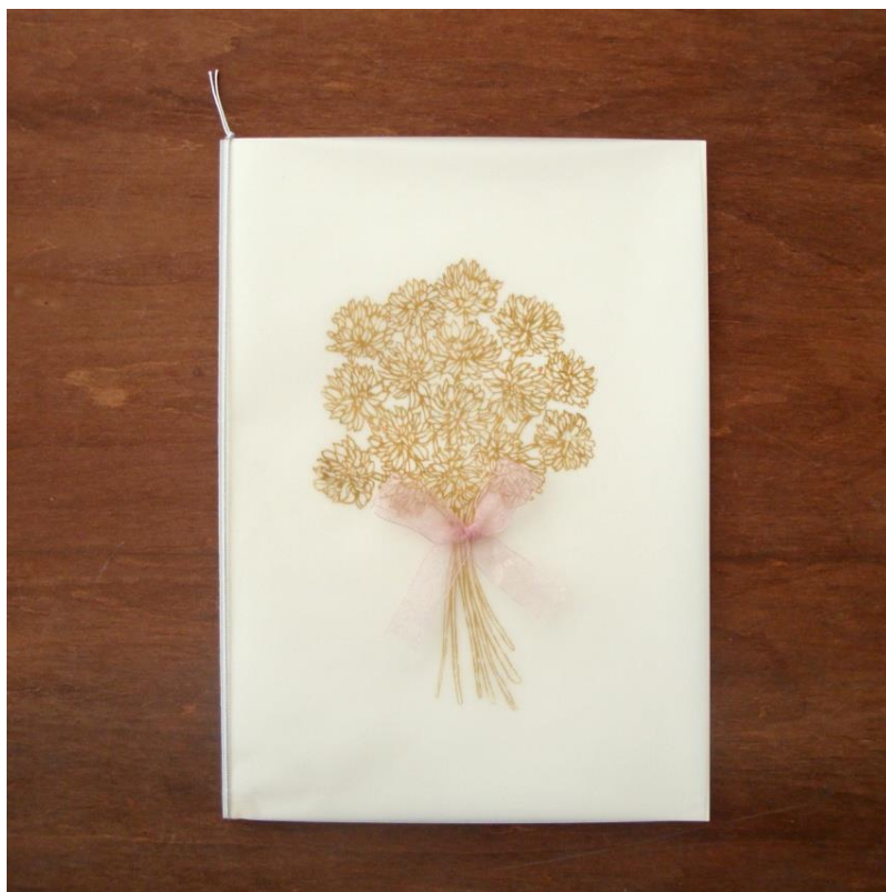
シロツメレース (鈴付き) テールグリーン